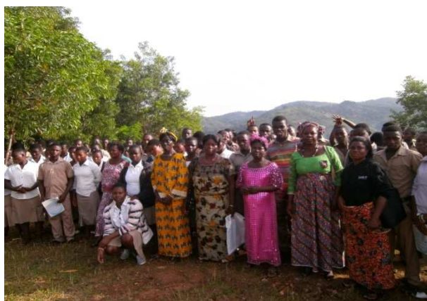
Vue d'ensemble équipe projet – enseignants – élèves