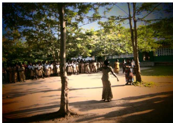
La présidente de W. Group en pleine sensibilisation