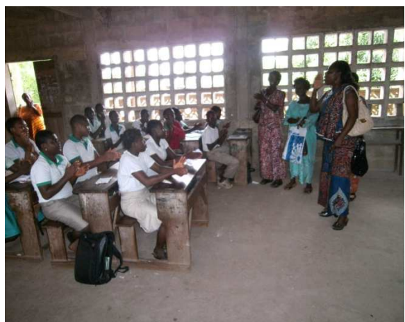
Appréciation des élèves après le message