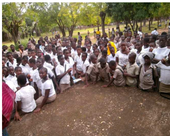
Vue d'ensemble des participants(e)