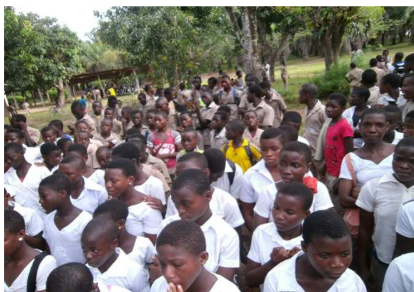
Une vue d'ensemble des participants