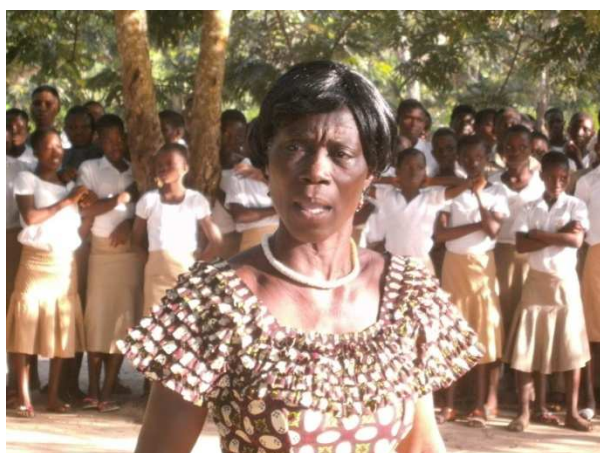
Un membre du groupe en pleine sensibilisation