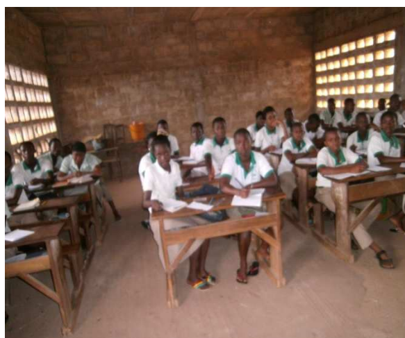
Séance de débat avec les élèves après le message