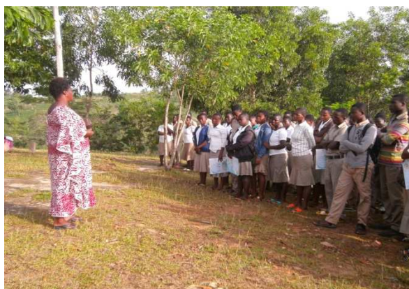
Un membre de l'équipe lors de sa communication