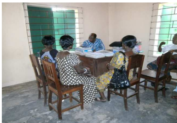
L'équipe en concertation avec un Directeur CEG