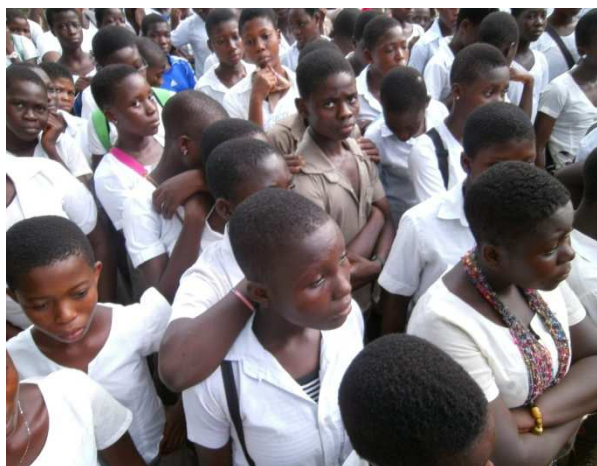
Les participants très attentif à la communication