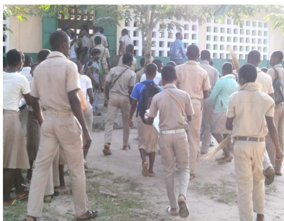
Elèves reprenant les classes après sensibilisation