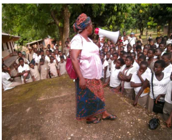
Un membre de l'équipe en pleine communication